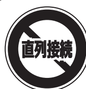
LED キャンセラー接続図（並列接続）