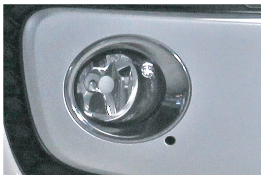
図1.丸型フォグランプ

図1の様な丸型フォグランプ(バルブ形状HB4) 装着車 up!、ゴルフ5、ゴルフ6、ゴルフトゥーラン、シロッコ、トゥアレグ、 ティグアン(5N、~2016)、ザ・ビートル(2016.09~) など